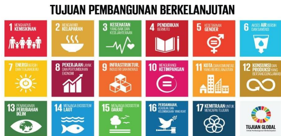
Gambar 1. Tujuan Pembangunan Berkelanjutan.

Perlu diketahui bahwa dalam pengusulan proposal program KKN Tematik tahun 2023 harus memperhatikan beberapa hal, diantaranya 1) Pola kemitraan; 2) Kontribusi terhadap ketercapaian indikator kinerja utama (IKU); 3) Integrasi Al-Islam dan Kemuhammadiyah. Seluruh tujuan pencapaian Program KKN Tematik mengacu kepada Arah Pembangunan Desa Berkelanjutan ( Sustainable Development Goals; SDGs ) 2020-2024 yang dapat dilihat pada Gambar 1.